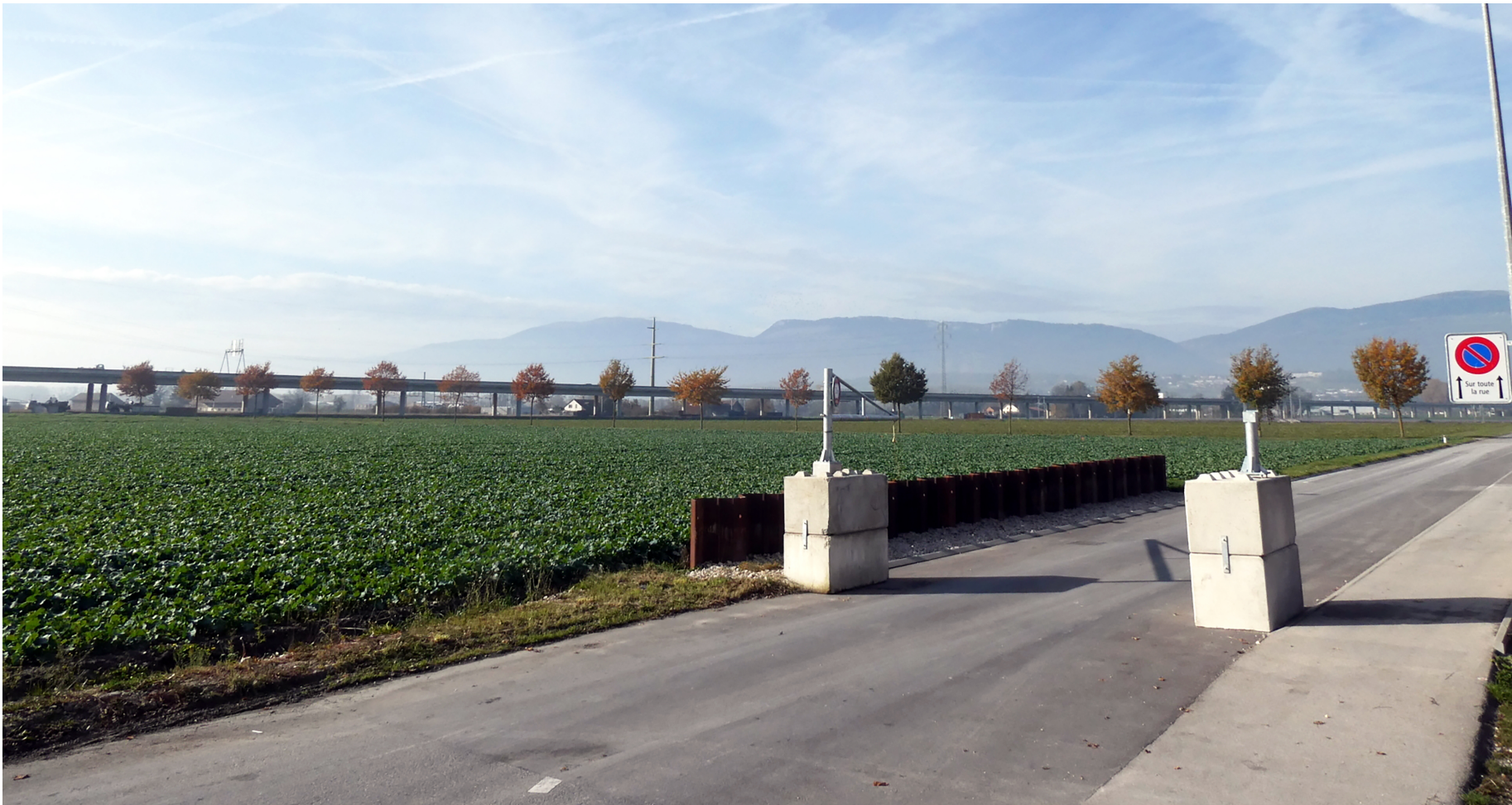
La parcelle susceptible d'éventuellement accueillir le nouveau site des eHnv se trouve entre l'avenue de l'Innovation, l'autoroute et le tracé des rails CFF. JPW